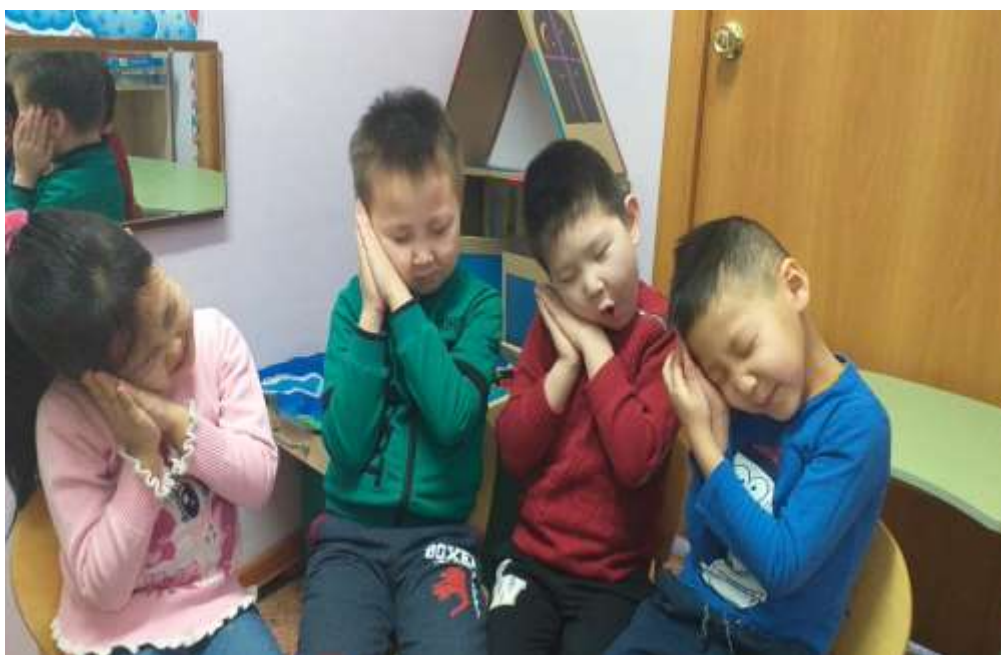
«Куоска оџото сынньанар» релаксация