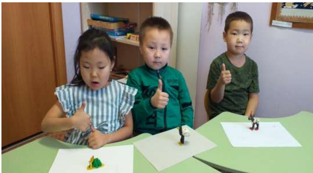
- Оџо айар дьоџурун сайыннарыы;